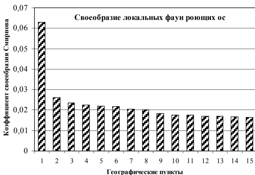
Рис. 3. Своеобразие локальных фаун роющих ос. Географические пункты: 1 – Владивосток, 2 – Хабаровск, 3 – Абагайтуй, 4 – Южно-Курильск, 5 – Архара, 6 – Ангарск, 7 – Кяхта, 8 – Южно-Сахалинск, 9 – Чита, 10 – Магадан, 11 – Охотск, 12 – Братск, 13 – Якутск, 14 – Танхой, 15 – Елизово.

ву являются переходными между фауной Иркутской обл. (основу которой составляют широкораспространенные палеарктические виды, связанные с мелколиственными лесами или открытыми пространствами) и фауной Южного Приморья (образованной, главным образом, видами, так или иначе связанными с широколиственными неморальными лесами), с некоторой долей (довольно существенной в Ангарске, Кяхте, Абагагуе, Архаре и Владивостоке) степных и пустынно-степных видов скифского и тетийского происхождения. Несколько особняком стоят сильно обедненные фауны Магадана и Охотска, состоящие почти исключительно из голарктических лесных и лесостепных и палеарктических полизональных видов.