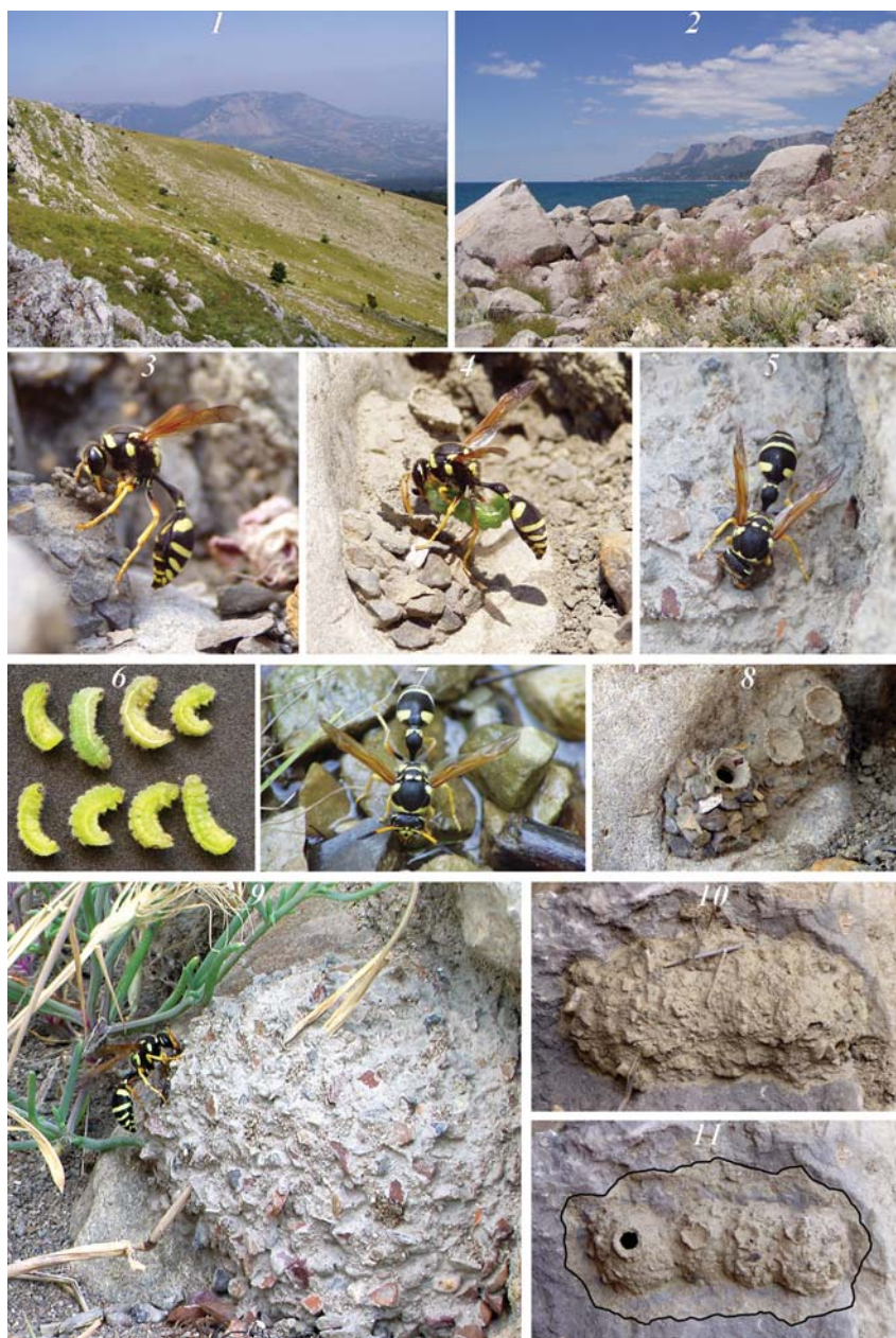
Рис. 1. Гнездование Katamenes flavigularis : 1 — станция гнездования на южном склоне Чатырдагской яйлы; 2 — станция гнездования на берегу моря в окрестностях поселка Качивели; 3 — самка, занятая строительством горлышка ячейки; 4 — самка, укладывающая в ячейку гусеницу голубянки; 5 — самка, занятая строительством общего покрытия гнезда; 6 — гусеницы голубянок, извлеченные из одной ячейки; 7 — самка, занятая сбором воды; 8 — одно из гнезд на стадии строительства третьей ячейки, две предыдущие уже запечатаны и покрыты дополнительным слоем замазки; 9 — наиболее крупное из обнаруженных гнезд; 10 — полностью отстроенное гнездо; 11 — то же гнездо с удаленным общим покрытием (его границы отмечены черным контуром), пробка одной из ячеек вскрыта осой-блестяжкой Stilbum calens при попытке выхода на свободу после отрождения.

Fig. 1. Nesting of Katamenes flavigularis : 1 — nesting station on the south slope of Chatyrdag mountain pasture; 2 — nesting station on the sea coast near Katsyveli village; 3 — female building the collar of the cell; 4 — female putting blue caterpillar into the cell; 5 — female building the general cover of the nest; 6 — blue caterpillars taken out from one cell; 7 — female collecting water; 8 — a nest on the stage of the third cell building; two previous cells have been already sealed and covered by additional mastic layer; 9 — the largest of the found nests; 10 — a completed nest; 11 — the same nest, general cover was moved off (its borders are marked by black contour), the seal of one cell was opened by gold-wasp, Stilbum calens trying to come out after eclosion.